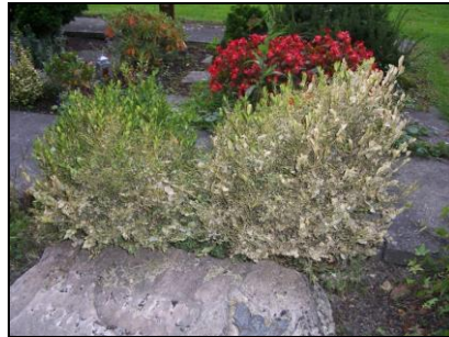
Photo 6 : 10 litres de chenilles ont été collectés manuellement sur cette haie de 16 m de long située dans un jardin privé en Haute-Savoie ! 08/2013 © P. Sermeus. Ten liters larvae have been manually collected along this 16 m long hedge in a private garden in Haute-Savoie

Photo 5 : Dans un cimetière, buis largement défoliés et menacés de dépérissement. © C. Brua. Box trees growing in a graveyard already extensively defoliated and threatened by decline.