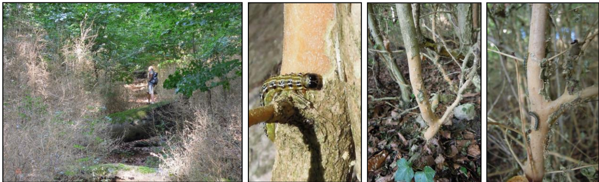
Photo 7 : Massifs de buis défoliés du Buxberg. Chenilles affamées rongent l'écorce. 08/2013 Defoliated box tree grove of the Buxberg. Starving larvae gnawing bark. August 2013

En Europe, pour l'instant l'espèce a été uniquement observée sur les buis, Buxus spp. ( B. microphylla , B. microphylla var. insularis , B. sempervirens , B. sinica ) (OEPP, 2007). Dans la littérature scientifique chinoise d'autres plantes-hôtes sont citées : le houx à feuilles pourpres ( Ilex purpurea ), le fusain du Japon ( Euonymus japonicus ) et le fusain ailé ( Euonymus alatus ). De ce fait, il n'est pas exclu de trouver des chenilles sur les plantes locales appartenant aux mêmes genres soit donc le houx ( Ilex aquifolium ) et le fusain d'Europe ( Euonymus europaeus ) (LEPIFORUM, 2008).