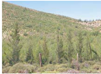
Plantation de cyprès en bordure d'un reboisement de pins (Turquie)

Protection : surveillance de la plantation par des gardiens.