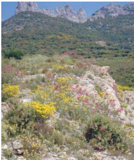
Végétation dégradée sur sol calcaire (France)

La mise à nu du sol suite à l'incendie ainsi que les modifications structurales induites par le feu augmentent très fortement les risques d'érosion. Ceux-ci dépendent : - De la pente. Plus elle est forte, plus les risques de ravinement sont importants. - De la nature géologique et pédologique du terrain. Les sols argileux sont très sensibles à l'érosion. - De la répartition et de l'intensité des précipitations. Des pluies violentes sur un sol mis à nu peuvent engendrer des dégâts considérables sur place et en aval (inondations, coulées de boue...).