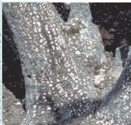
Ecorce après incendie (France)