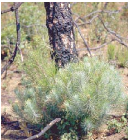
Rejets au pied d'un pin des Canaries (Maroc)

La régénération d'un peuplement peut se faire selon deux modalités : germination (caractéristiques des résineux) ou émission de rejets. Beaucoup de feuillus et un très petit nombre de résineux (genévrier, thuyas de Barbarie, pin des Canaries) ont la capacité de rejeter. Il s'agit généralement de rejets sur souches, les parties souterraines ayant survécu à l'incendie. Pour certaines espèces, les rejets peuvent être émis à partir des parties aériennes ; ainsi Quercus suber reconstitue son houppier relativement facilement suite au passage d'un feu modéré.