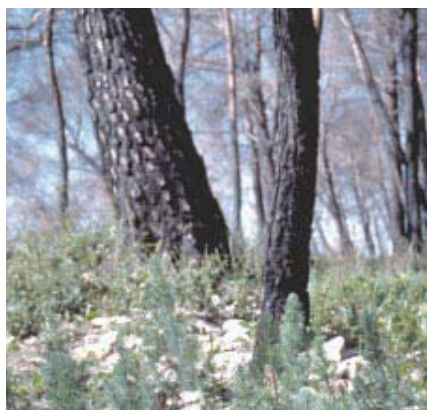
Régénération naturelle de pin d'Alep (France)

Elle doit être privilégiée lorsqu'elle est possible.