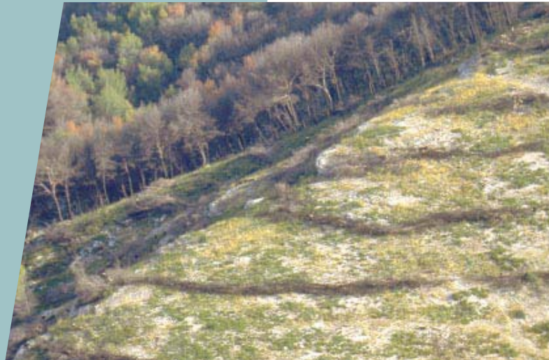
Fascines posées le long des courbes de niveau (France)