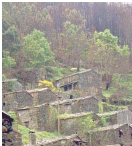
Paysage brûlé à proximité d'un village (Portugal)

L'incendie entraîne un changement brutal du paysage transformant le cadre de vie de la population en un environnement calciné. La disparition d'une végétation basse semble toutefois plus facile à accepter que celle des arbres d'une forêt.