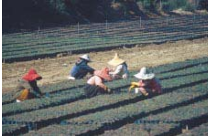
Femmes travaillant dans une pépinière (Syrie)