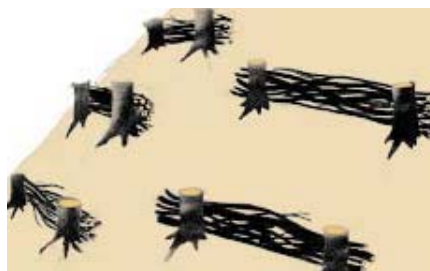
Mise en place de fascines

Ex : La Grèce a eu recours à ce procédé suite aux incendies de l'été 1998 près d'Athènes. Localement, la France se sert de cette technique pour limiter les risques d'érosion dans des zones brûlées très pentues, où les orages de la fin de l'été peuvent avoir des conséquences catastrophiques.