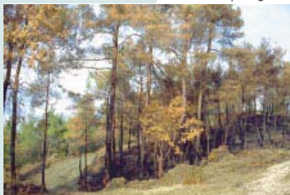
Impact du feu sur le feuillage (France)

La résistance au feu varie suivant les espèces, notamment en fonction de l'épaisseur de l'écorce. Dans le cas du chêne-liège, l'assise cambiale est protégée par le liège, matériau