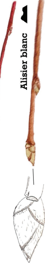
▲ Alisier blanc