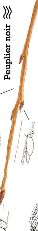
≡ Peuplier noir