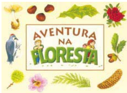
Jeu de l'oie (Portugal)