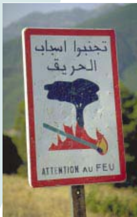
Panneau de sensibilisation (Maroc)